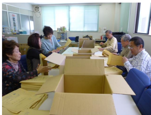
会報用封筒地区別振り分け作業 於 神商イフレ館 1 階